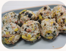
D.I.Y 참치 주먹밥 D.I.Y rice ball with tuna $12