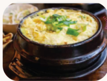
돌솥 계란 찜 Steam egg stone pot $19