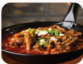
매운 닭발 Spicy chicken feet $31