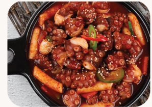
문어 볶음 Spicy stir fried octopus $36