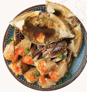
*** 간장 게장 (중 / 대) Soy raw crab 1pcs - $19 3pcs - $57