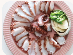
문어 속회 Poached octopus $30