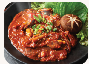
꼼장어 볶음 Spicy stir fried hagfish $35