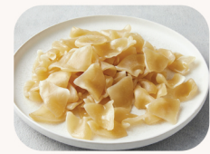
감자 수제비 Korean style pasta *Potato flavour $5