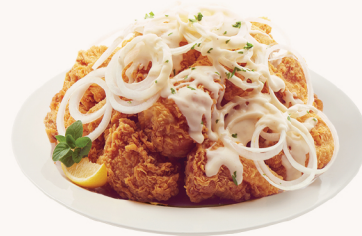
소어 크림 Sour cream $22