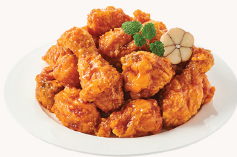
고추 마늘 Soy chilli $22 (Gomachi)