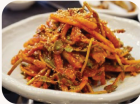
한치 회 무침 Spicy squid sashimi salad $35