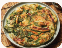
해물 파전 Seafood pancake $22