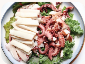
오징어 속회 Poached squid $28