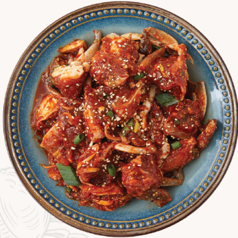
*** 양념 게장 (중 / 대) Spicy raw crab M - $19 L - $35