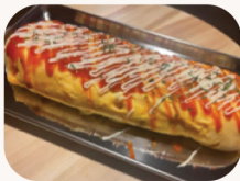
치즈 계란말이 Cheese egg roll $25