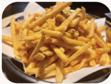
스노빙 칩스 Snowing chips $15