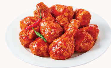
마라 양념 Chiness mala $22 sweet