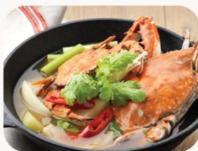
알꽃게 전골 Fish roe and blue crab hot pot $52