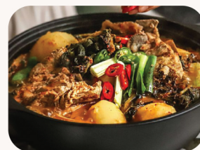
돼지갈비 감자탕 Pork rib potato hot pot $48