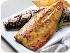
고등어 구이 Grilled mackerel $28