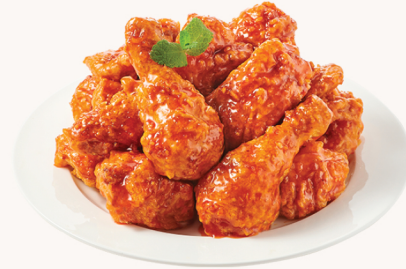
★★★★ 양념 Sweet chilli