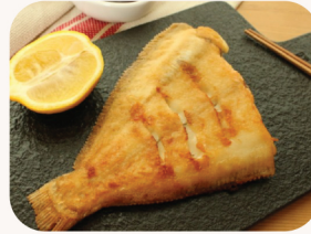
가자미 구이 Grilled flat fish $29