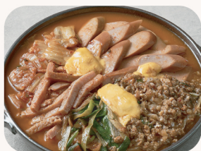
부대 전골 Army hot pot $37