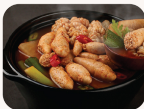
알탕 Fish roe soup $34