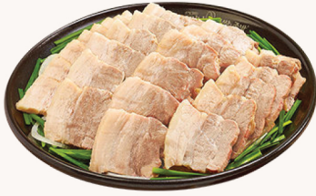
삼겹 수육 Slow cooked pork belly