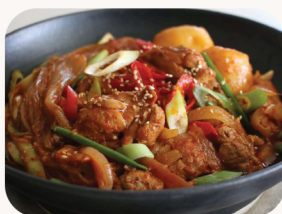
닭볶음탕 Spicy chicken stew Boneless / Bone-in $48