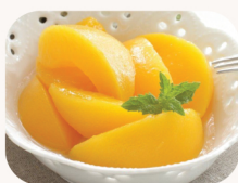
황도 Sliced peach in syrup $18