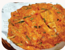
김치 해물 파전 Kimchi seafood pancake $22