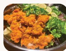
유링기 치킨 Chicken salad (Yuringi) $32