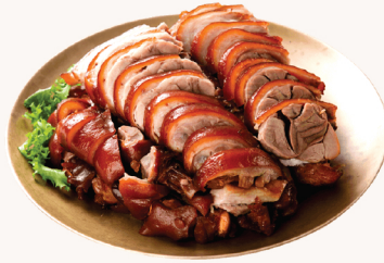
족발 Slow cooked pork hock