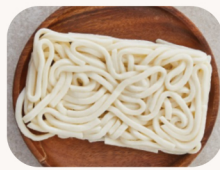
우동 사리 Udon noodle $6