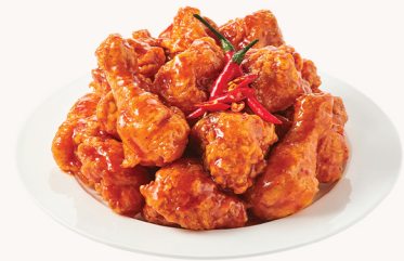
매운 양념 Hot chilli $22