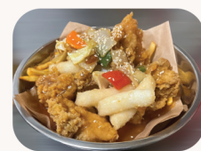
랑수육 치킨 Sweet and sour chicken $32