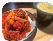
매운 양념 풍류 치킨 Hot chilli fondue chicken $32