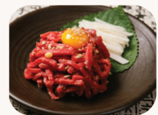
육회 / Yuk Hoe Raw beef salad $26