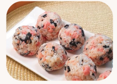
D.I.Y 스팸 주먹밥 D.I.Y rice ball with spam $14