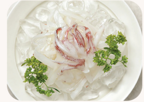
한치 회 Squid sashimi $28