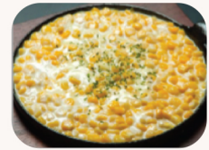
콘치즈 Corn cheese $15