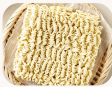
라면 사리 Ramen noodle $5