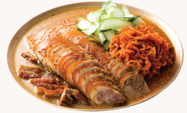
냉채 족발 Wasabi sauce pork hock salad