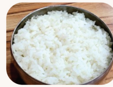
공기밥 Bowl of steamed rice $3