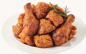
허니 간장 Honey soy $22