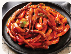
오징어 볶음 Spicy stir fried squid $32