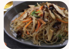
잡채 / Jap Chae Beef potato nooble $19