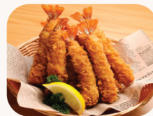
새우 튀김 Panko prawn (5 pcs) $15