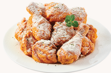
눈꽃 치즈 Snowing cheese $22