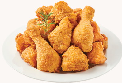
★★★★ 후라이드 Original fried

Extras Rice cakes(8pcs) $4 Extra Sauce $3