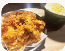
풍류 치킨 Original fondue chicken $32