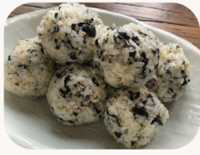
D.I.Y 주먹밥 D.I.Y rice ball $8