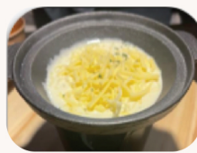
퐁듀 소스 Fondue sauce $9