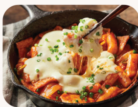
치즈 떡볶이 / Toppokki Cheese spicy ricecake and fishcake $25