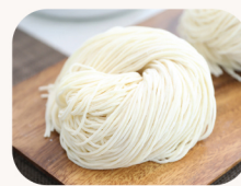
소면 사리 Thin noodle $5