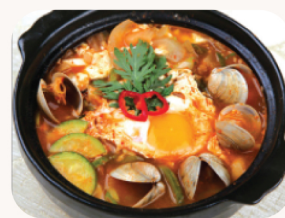
순두부 찌개 Soft tofu soup $22