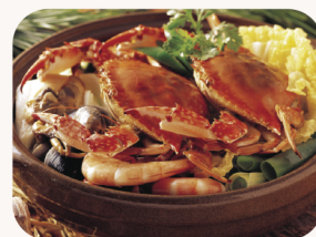
꽃게탕 Blue creb soup $37