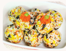
D.I.Y 날치알 주먹밥 D.I.Y rice ball with fish roe $14