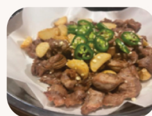
닭통집 Chicken gizzard $19