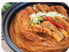
돼지갈비 김치전골 Pork rib Kimchi hot pot $48