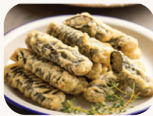
김말이 Seaweed rolls (10 pcs) $15