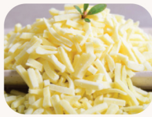
모차렐라 치즈 Mozzarella cheese Melted / Raw $6