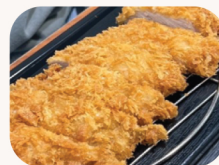
돈까스 Ton katsu (Pork cutlet) $28