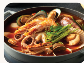
해물 전골 Assorted seafood got pot $52