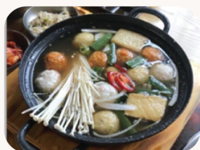
오뎅탕 Fishcake soup $29